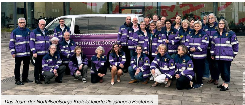
Das Team der Notfallseelsorge Krefeld feierte 25-jähriges Bestehen.