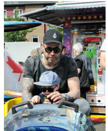
Beliebt bei den kleinen Gästen: Der Mini-Jet.

Nach fünf Jahren wieder eine Kirmes nach Fischeln zu holen, war für die Veranstalter alles andere als leicht. Trotz aller Schwierigkeiten