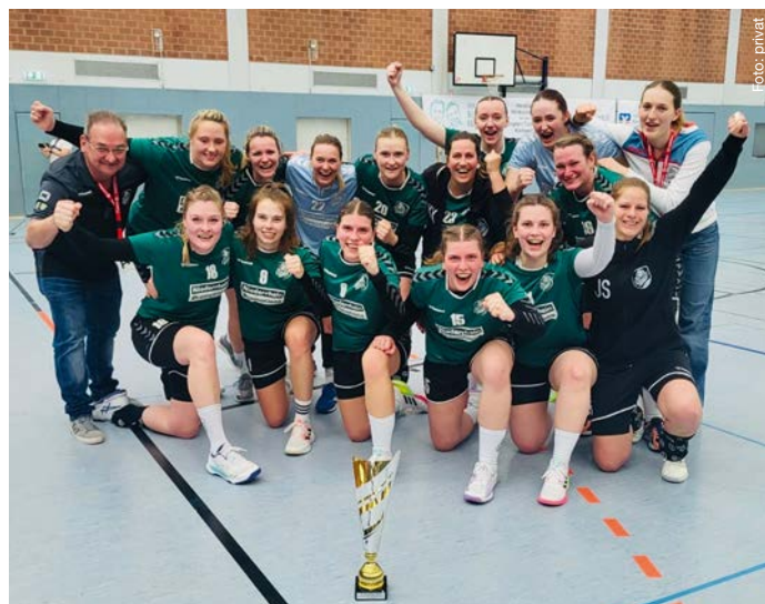
Die 1. Damenmannschaft der DJK Olympia Fischeln freute sich riesig über den Kreispokal-Gewinn des Handballbezirks Krefeld-Grenzland.