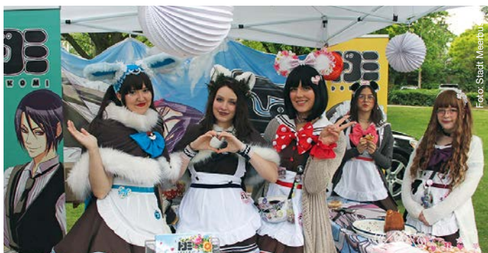
Die beliebten Dokomi-Maids begrüßen Jahr für Jahr die Besucher der Dokomi-Messe in Düsseldorf. Auf dem Meerbuscher Kirschblütenfest sind die Maids inzwischen Stammgäste. Die Dokomi gehört zu Europas größten Kult-Veranstaltungen für Anime-, Manga- und Japan-Fans.

Das Kirschblütenfest lockt in Japan alljährlich zu Beginn des Frühlings tausende Menschen zum fröhlichen Miteinander in Parks und Gärten. Jung und Alt verabschieden den Winter und genießen im Familien-, Freundes- oder Kollegenkreis das Aufkeimen einer neuen Blüten-saison. Die Kirschblüte ist zudem eines der wichtigsten Symbole der japanischen Kultur. Sie steht für Schönheit, Aufbruch und Vergänglichkeit. Die Idee, ein solches Frühlingsfest auch in Meerbusch zu etablieren, ist beim Besuch der Delegation aus Meerbuschs Partnerstadt Shijonawate im Jahr 2018 entstanden.