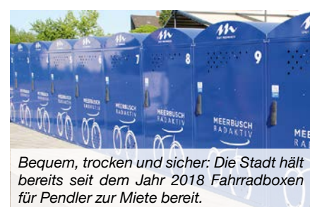
Bequem, trocken und sicher: Die Stadt hält bereits seit dem Jahr 2018 Fahrradboxen für Pendler zur Miete bereit.